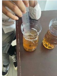
Gambar 2. Air gambut setelah proses pengadukan koagulan, terlihat mulai terjadi perubahan warna menjadi lebih jernih dan flok mulai terbentuk di dalam wadah.

Setelah dilakukan penambahan koagulan dan pengendapan, air gambut mengalami perubahan warna dan kejernihan yang cukup terlihat. Warna air yang semula coklat pekat menjadi lebih terang dan partikel kotoran berhasil menggumpal serta mengendap di dasar botol. Proses ini menunjukkan bahwa koagulasi sederhana dengan botol bekas dapat membantu menurunkan kekeruhan air gambut secara efektif. Hasil ini mendukung tujuan pengolahan sederhana yang dapat diterapkan masyarakat dengan peralatan mudah diperoleh.