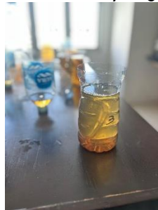
Gambar 3. Air gambut setelah proses pengendapan, tampak lebih jernih di bagian atas dengan flok endapan partikel kotoran di dasar botol bekas.

Setelah proses pengadukan selesai, air gambut dibiarkan agar flok hasil koagulasi dapat mengendap di dasar wadah. Pada tahap ini terlihat lapisan air di bagian atas menjadi lebih jernih, sedangkan endapan partikel kotoran terkumpul di dasar. Proses pengendapan ini menunjukkan bahwa koagulan bekerja efektif menggumpalkan partikel halus yang semula tersuspensi. Semakin lama waktu pengendapan, kualitas kejernihan air di bagian atas semakin baik. Hasil ini membuktikan bahwa metode sederhana menggunakan botol atau gelas bekas dapat membantu memisahkan kotoran dengan biaya rendah dan cara yang mudah diterapkan masyarakat.