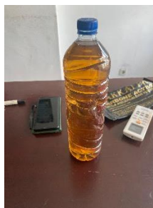
Gambar 1. Air gambut sebelum dilakukan proses koagulasi, tampak berwarna coklat pekat dan keruh di dalam botol bekas.

Air gambut yang digunakan berwarna coklat pekat, berbau khas gambut, dan memiliki tingkat kekeruhan tinggi akibat kandungan zat organik dan partikel halus. Kondisi ini menunjukkan bahwa air gambut tidak layak digunakan tanpa pengolahan terlebih dahulu. Oleh karena itu, diperlukan proses koagulasi untuk menurunkan kekeruhan dan memperbaiki kualitas air.